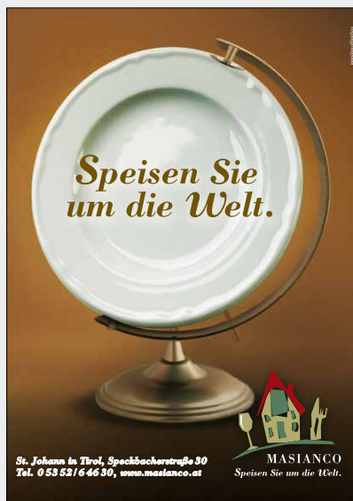
1/1 Seite Breite x Höhe: 200 x 265 mm