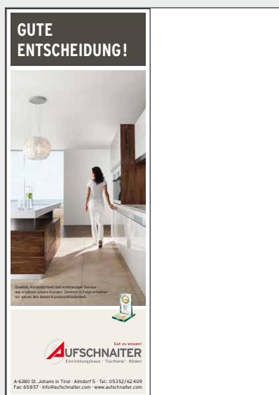
1/2 Seite Hochformat Breite x Höhe: 98 x 265 mm